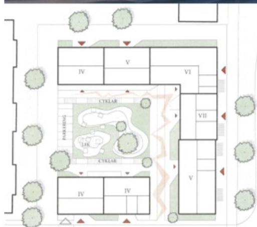
Illustration över ny bebyggelse ut mot Mariehemsvägen, vy från sydost. Situationsplan enligt sökande på ny bebyggelsestruktur inom området. Illustrationer Nyréns Arkitektkontor.