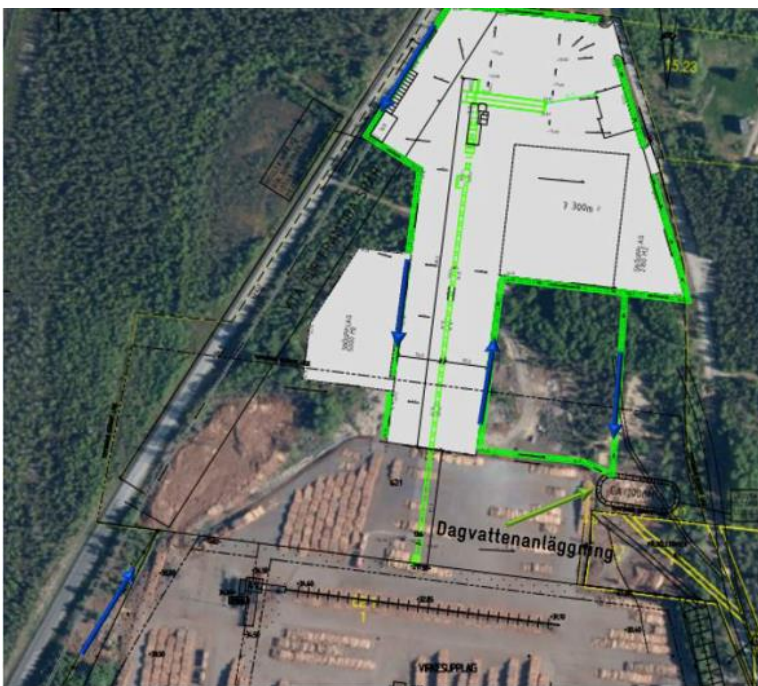
Figur 2. Översikt av planerad utökning av verksamhetsområdet. Allt dagvatten från området leds till planerad dagvattenanläggning.

Sävar såg ämnar anlägga en dagvattenreningsanläggning som fångar dagvatten från delar av befintligt område samt hela den planerade utökningen av området, se Figur 2 och Figur 3. Alla diken som leder till anläggningen samt anläggningen i sig planeras att utföras med tät duk för att inte dagvattnet ska kunna infiltrera till Sävaråsen.