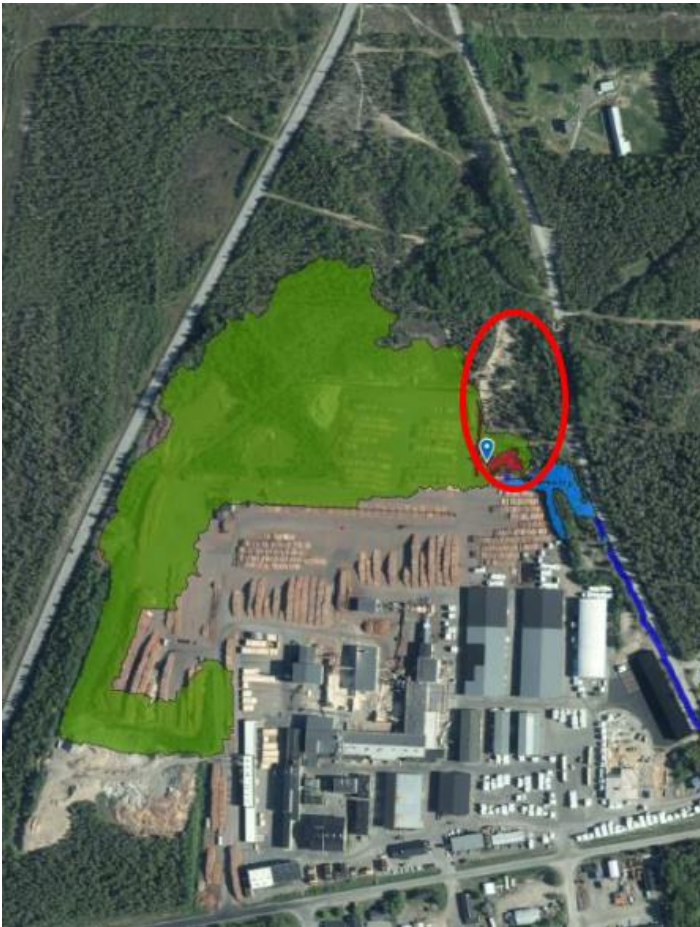
Figur 3. Befintligt område som planeras avledas mot framtida dagvattenanläggning markerat i grönt. Röd ellips markerar placering av framtida dagvattenanläggning.

Anläggningen planeras byggas upp i tre steg; en fördröjningsdel, en försedimentering samt ett polersteg för bioupptag av lösta föroreningar.