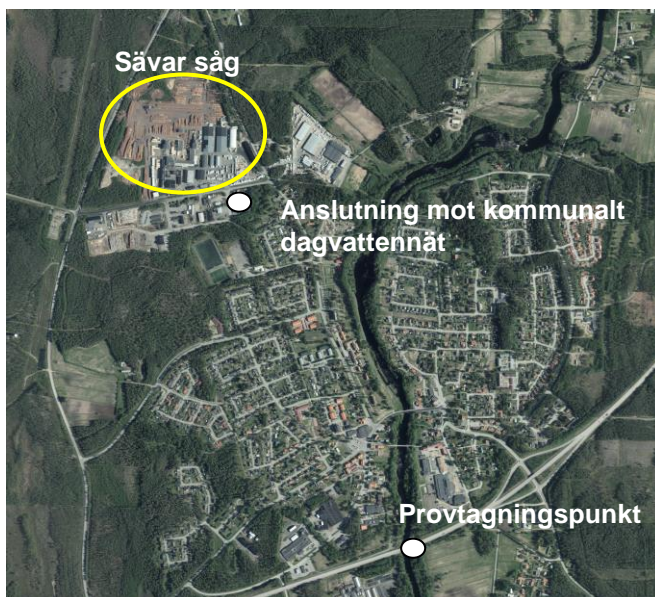
Figur 1. Översiktsbild på Sävar med Sävar sågs område och provtagningspunkt utmarkerat.

För beräkningar av halt och påverkan på Sävarån har data från SLUs miljödatabas MVM använts (provtagningspunkt Sävarån, E4an). Provtagningspunkten ligger nedströms Sävar Sågs anläggning.