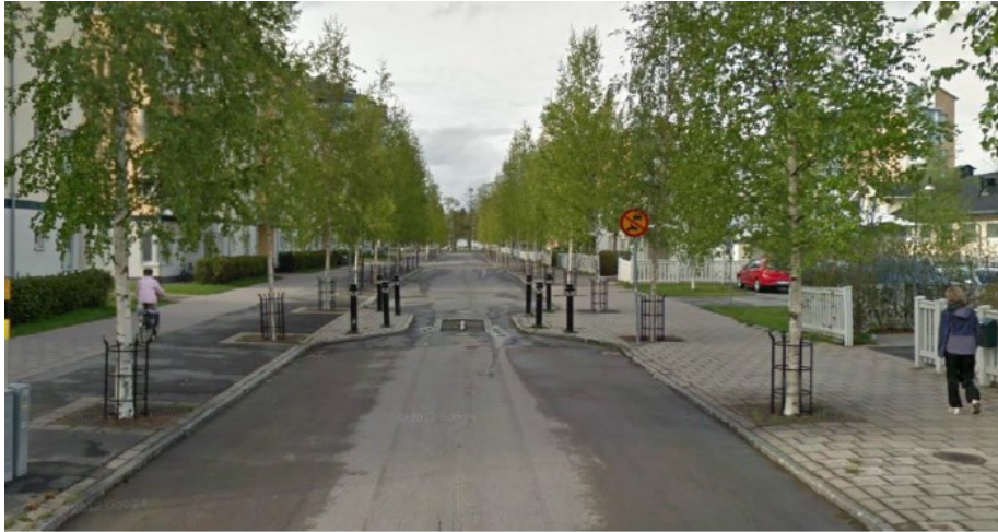
Bild från Brogatan med avsmalning i gatan.

Brogatan, mellan stadshuset och Ridvägen har goda möjlighet att hantera ökade flöden, men det påverkar korsningen med gång- och cykelstråket längs Nygatan/Dragongatan negativt och en bättre lösning för gc-vägen behöver hittas där den korsar Brogatan så att den blir mer trafiksäker.