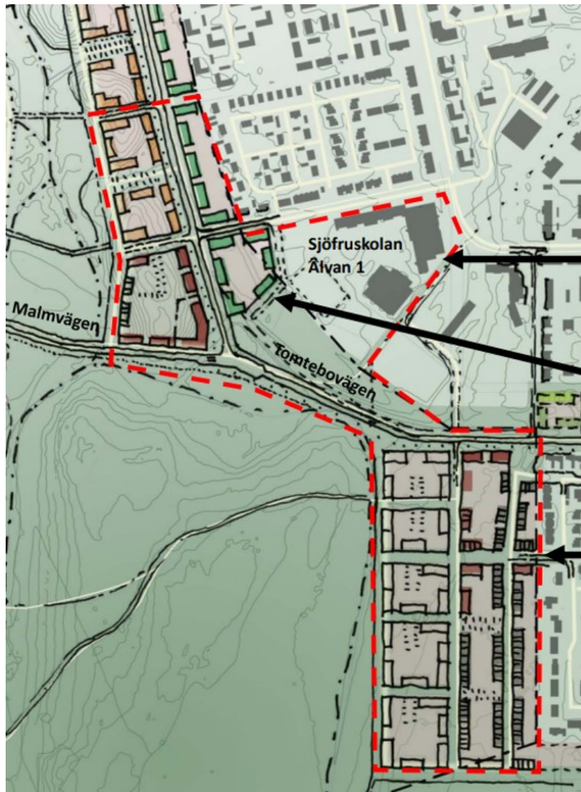
Figur 2: Preliminär avgränsning av området

Mark och exploatering har ansökt om planläggning av del av grönområde mellan Tomtebo och Carlshem. Planläggning utgör andra etappen av den utveckling i området som föreslagits i strukturstudien för området mellan Tomtebo och Carlshem som togs fram 2018. Illustration från strukturstudien finns på bilden nedan.