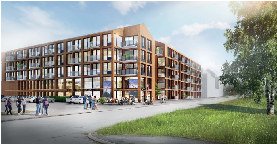
Illustration från ansökan

Avgift för planbesked tas ut för stor åtgärd med 18 720 kr.