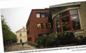
Koncept för ett nytt kulturhus kommer det att ligga kvar där Stadsbiblioteket står idag.

Centrat öppet läge med vatten, grönska och väl tillgängligt. Helena Tallus Myhrman