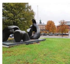
Slottstorget med Henry Moores skulptur.

de esplanaderna är karaktäristiska och vackra brandgator som Gävle måste bevara och vara stolt över. Exploatörer tittar nu på Slottstorget för att det är en nästan obebyggd. Det är synes enkelt att bygga ett kulturhus kvarter där eller annat och skapa ett kvarter i fyra-fem våningar på torget. Ytterligare en park skulle försvinna i Gävle stad. Kulturhuset kan byggas på annan plats. Till exempel kan nuvarande kvarter med bibliotek vara en lämplig plats för ett nytt hus, lämpligen efter en arkitekttävling om kvarterets utformning. Gatans sneddräpning